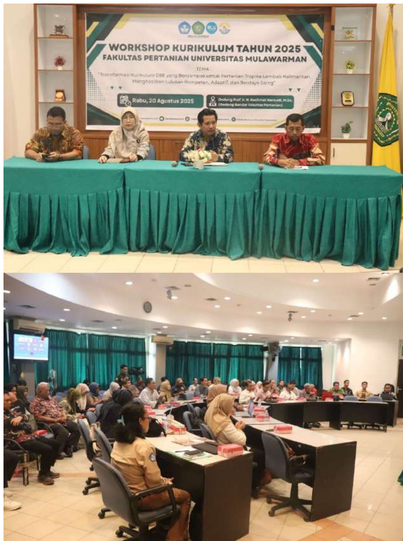
Gambar 1. Pelaksanaan Kegiatan di Gedung Prof. Rachmat Hernadi (Gedung Bundar), Fakultas Pertanian Universitas Mulawarman

Kegiatan ini dilaksanakan pada tanggal 20 Agustus 2025 dan bertempat di Gedung Prof. Rachmat Hernadi (Gedung Bundar) dan juga diikuti sivitas akademika secara luring serta daring. Acara tersebut dihadiri oleh para staf akademik dari berbagai program studi di lingkungan Fakultas Pertanian yang telah menerima undangan resmi. Kehadiran peserta sesuai dengan daftar undangan dan absensi yang tercantum dalam Lampiran 1 dan dokumentasi sebagai berikut.