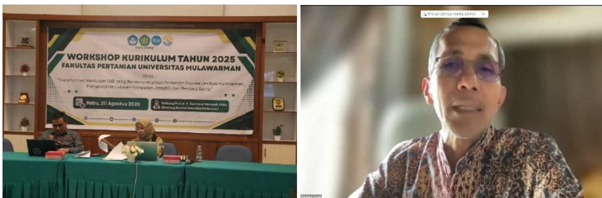
Gambar 2. Penyampaian materi Workshop

Dengan demikian, materi kegiatan workshop tidak hanya membahas aspek konseptual mengenai penyusunan kurikulum, tetapi juga aspek praktis yang mencakup strategi pembelajaran, mekanisme penilaian, integrasi isu-isu global, hingga sistem penjaminan mutu. Seluruh rangkaian materi dirancang untuk memastikan bahwa kurikulum Fakultas Pertanian Universitas Mulawarman mampu menghasilkan lulusan yang unggul, berdaya saing, serta relevan dengan kebutuhan pembangunan pertanian tropika lembab di Kalimantan maupun tantangan global di masa depan.