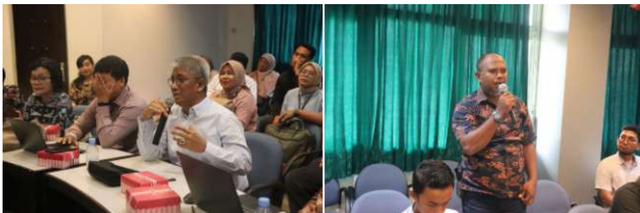
Gambar 3. Sesi diskusi dan tanya jawab isu startegis

Secara umum, diskusi dan tanya jawab dalam workshop ini menekankan pentingnya keselarasan antara visi-misi universitas dengan kurikulum program studi. Distribusi mata kuliah harus sederhana dan mudah dipahami mahasiswa, mata kuliah penciri program studi perlu diperkuat, dan publikasi ilmiah dipandang sebagai bagian integral dari proses pembelajaran. Evaluasi kurikulum diarahkan untuk mengukur ketercapaian CPL melalui penilaian di level CPMK, sementara penjaminan mutu dilakukan melalui siklus PPEPP agar kurikulum selalu adaptif terhadap perkembangan ilmu pengetahuan, teknologi, serta kebutuhan masyarakat.