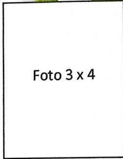
Foto 3 x 4