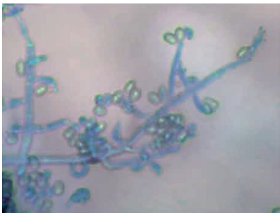
Gambar 28 Trichoderma sp.

Pada penelitian ini ditemukan beberapa jamur endofit pada tanaman cabai yaitu Trichoderma sp. , Penicillium sp. , Rhizopus sp. dan Aspergillus sp.