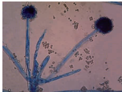
Gambar 29 Aspergillus sp.