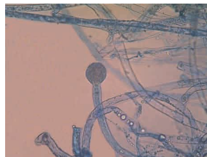
Gambar 31 Rhizopus sp.