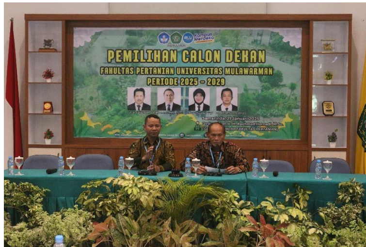
Pembukaan Rapat Senat Terbuka: Pemaparan Visi Misi Calon Dekan Fakultas Pertanian Universitas Mulawarman Periode 2025 – 2029.