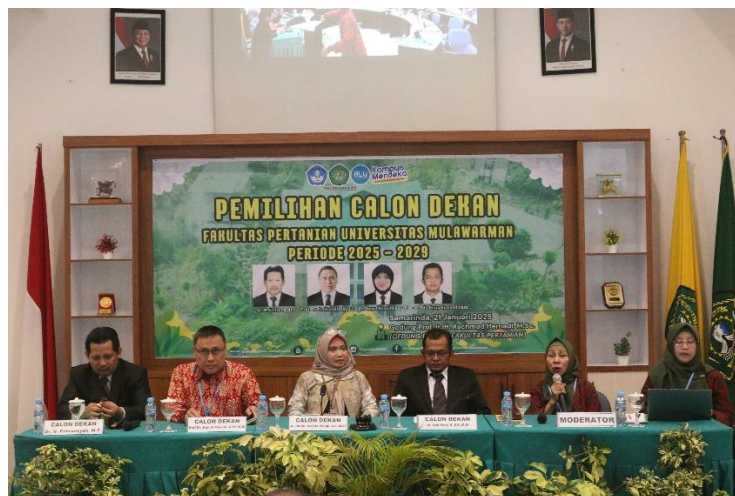
Pemaparan Visi Misi Calon Dekan Fakultas Pertanian Universitas Mulawarman Periode 2025 – 2029 dipimpin oleh Moderator