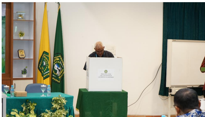
Proses Pemungutan Suara