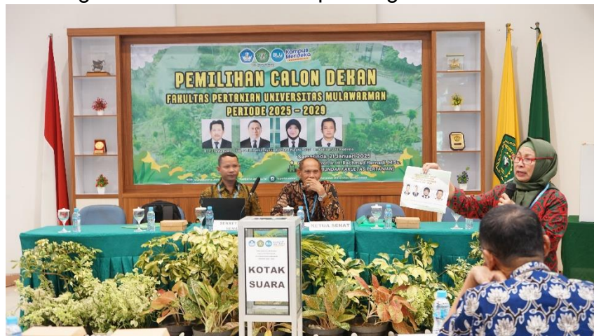
Penyampaian Teknis Pemungutan Suara Oleh Ketua Panitia